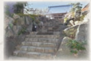
檀家によってつくられた石積み階段

心も育てることも修行。ご先祖様に感謝の心を届けることも修行となり。皆さん一人ひとりの中には、「仏種」という仏になる種(悟りを開く可能性)が宿っているというお釈迦様の教えがあります。合掌してお辞儀をすることによって、仏の心を育てることが出来るのです。 28章ある法華經の中に、どんな地位や身分の人にも「将来、仏になるあなたに尊敬の念を送ります」と合掌・礼拝を続けたいという、菩薩について書かれたお経があります。「一人ひとりの中に仏がいます。合掌してお辞儀をすることは感謝の心を、悟りの心を気付かせてくれるのです。 感謝の気持ちがあれば、ねたみや恨みなどの感情は出てこなくなります。周りの人に「ありがとう」と言葉で出すことによつて相手も自分も認識することが出来ます。どのような時でも、すべての人を敬い、寄り添う気持ちを忘れないようにしたいものです。