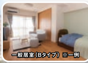
一般居室(Bタイプ) ※一例

土浦市街を一望に見渡せる高台に位置し、天気の良い日は 各部屋から富士山が望めます。毎年秋の「土浦全国花火競技大会」は、 ご家族とともにホームからの観賞をお楽しみいただけます。