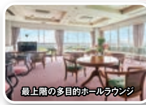
最上階の多目的ホールラウンジ