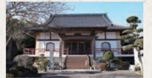
日蓮宗 観成院 牛久市牛久町48番地 ☎029-872-0631