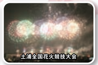
土浦全国花火競技大会