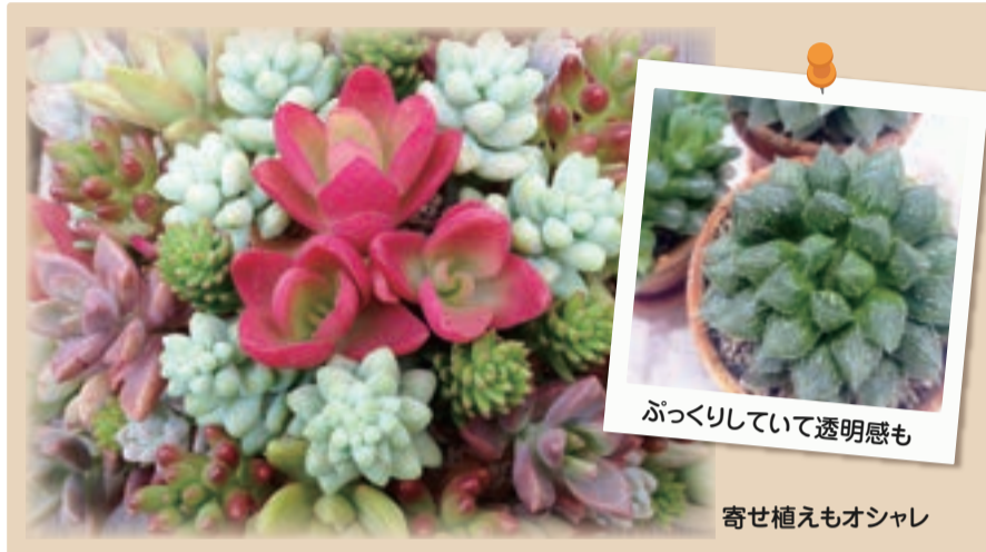
ぷっくりして透明感も