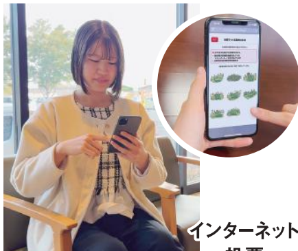
インターネット投票

世界には多くの共通課題があります。少子高齢化、気候変動、農業と食料安全保障、働き方改革、ジェンダー平等、貧困と格差、これらの問題を全て解決している都市はまだありません。だからこそ、つくばには市民とともに新たな挑戦をしながら、市民生活の課題を解決し、市民が幸せに安心して暮らせるまちへ進んでいく使命があります。