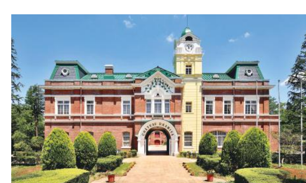
日本初の本格的ワイン醸造場「牛久シャトー」

今年度は、「地域公共交通計画」の改訂を進めております。市民の皆様へ公共交通に対する意見や動向などを調査するアンケートを実施し、更なる交通の利便性の向上のため、地域の特性に合わせた誰もが移動手段を選択できる環境を目指してまいります。