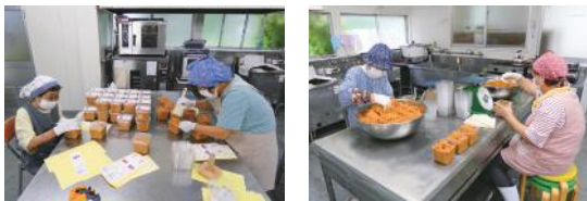
味噌を丁寧にパックに詰めて総仕上げ

衛生管理も徹底しており、使用する道具はすべて熱湯で消毒。納豆菌が混入すると麹菌のはたらきを妨げてしまうことから、仕込みの時期には納豆の摂取を控えるほどの厳格さだ。 『手作業は大変だけど、機械化だけでは守れない味があります。丁寧な仕事と人の手の温もりが、味噌の深い味わいを支えている。若い世代の参加や設備の充実といった課題を抱えながらも、地域の味を守るため、今年も味噌づくりに情熱を注いでいく。』