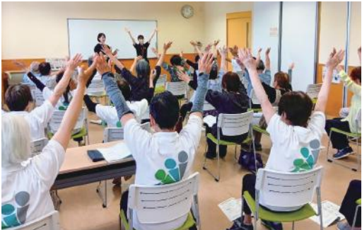
介護予防ノウハウ講座

いるほか、令和5年から6年に1248人の転入超過となるなど増加傾向にあり、この好機を土浦ならではのまちづくりにしつかりと繋げてまいりたいと考えております。