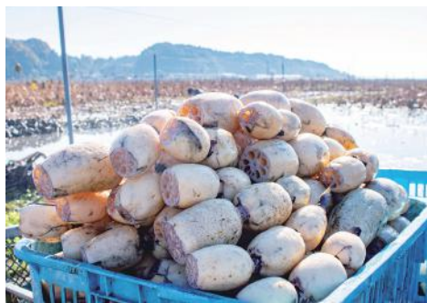
土浦市特産品 れんこん

そして、希望に満たなくわくするまちを創造するため、未来を見据えた施策を速やかに打ち出し、着実にその成果を収めることで、夢のある、元氣のある土浦のさらなる飛躍に向けて市民の皆様と一緒に前進してまいります。