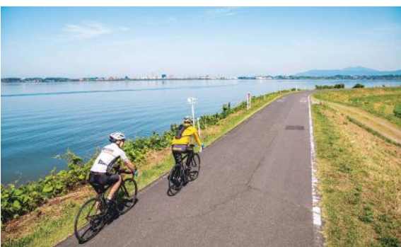
つくば霞ヶ浦りんりんロード

具体的には、「つくば霞ヶ浦りんりんロード」を最大限活用したサイクリングによる地域活性化、本市の誇る「土浦全国花火競技大会」をはじめとするイベント資源の効果的活用、本市に伝わる多様な文化財をまちづくりの核とした歴史・文化の継承などを推進しながら、魅力ある「地域の宝」を積極的に内外へPRすることで、本市のイメージアップや賑わい創出に取り組み、交流人口、移住・定住者の増加を図ります。