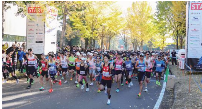
毎年多くの人が参加する「つくばマラソン」