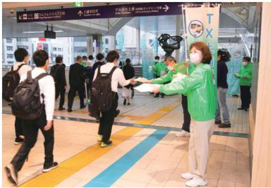
TX土浦延伸に向けたPR活動

高さ25mのオランダ型風車を中心に、花火や霞ヶ浦など土浦の地域資源をモチーフにした約19万球の灯りが会場を幻想的に彩る。