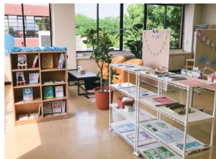
中高生や若者の悩みに寄り添う「青のカフェ」

具体的には、公職選挙でのインターネット投票の導入に向け、市民が様々なインターネット投票を体験する機会を増やし、その信頼性や使い勝手を高めていきます。それらを下支えするため、高齢者を対象にしたスマホ教室を実施し、情報格差を解消していきます。また、デジタル化による書かない、待たない、回らないワンストップ窓口を導入すると