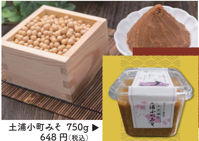
土浦小町みそ 750g ▶ 648円(税込)

地元の恵み、味噌に込めて 土浦ブランド認定品でもある天然醸造の「土浦小町みそ」の仕込みが、今年も11月から始まる。土浦市農業公社内で活動する「手作り食品研究会」(代表・大塚雄子さん)が手がけるこの味噌づくりは、地域の女性たちが中心となり、30年以上にわたって続けられてきた。現在は4人で製造を分担しながら、毎年約5トンもの味噌を生産している。 主な原料は、地元産の米や大豆に加え、九州産の天日塩、秋田から