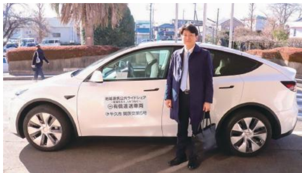
交通空白地の移動支援に 「地域連携型ライドシェア」を導入

また、このような高齢者介護サービスをはじめ、さまざまなサービスの高齢者のニーズや状態の変化に応じて切れ目なく提供できるよう、市の総合相談窓口として保健福祉、介護の専門家が支援を行う「地域包括支援センター」を設置しております。また、成年後見制度に関する相談窓口といたしましては、「牛久市成年後見サポートセンター」を設置し、より身近にさめ細やかな支援ができるよう努めております。